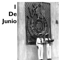
1 De Junio Día De La Marina

Para realizar un trabajo de calidad, debemos entender que vivimos todos los días del trabajo de otros seres humanos.